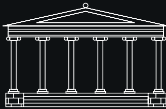
476 r p.n.e